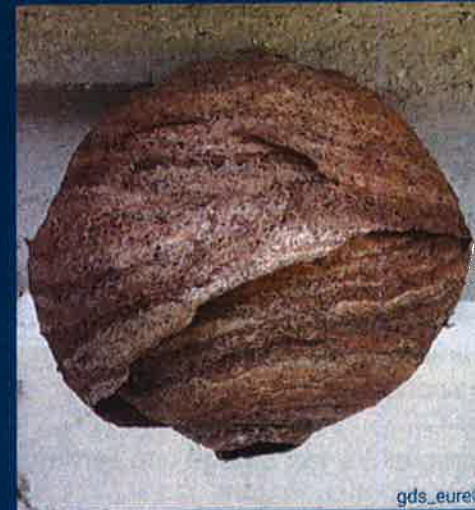
Nid Primaire (taille d'une orange) ruchette, cabane, trou de mur, bord de toiture, roncier..

Entre février et avril, la reine fonde sa colonie, en fabricant un nid primaire dans un endroit abrité (ruchette, cabane, trou de mur, bord de toiture, roncier...) puis la colonie peut se délocaliser vers un nid secondaire construit à un emplacement plus dégagé et plus élevé lorsque le site primaire devient trop étroit.